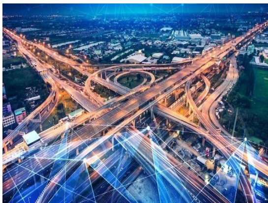
2-rasm: Smart Road texnologiyalarini aks ettiruvchi konseptual tasvir

O‘zbekiston transport tizimi so‘nggi yillarda jadal rivojlanmoqda. Avtomobil yo‘llarini kengaytirish, yangi magistrallar qurish, yo‘l harakatini tartibga soluvchi tizimlarni modernizatsiya qilishga katta e‘tibor talab qilinmoqda. Lekin zamonaviy global tendensiyalar shuni ko‘rsatadiki, oddiy yo‘l qurilishi emas balki aqlli yo‘l infratuzilmasini yaratish kelajakda transport samaradorligi va xavfsizligi uchun zarur bo‘ladi.