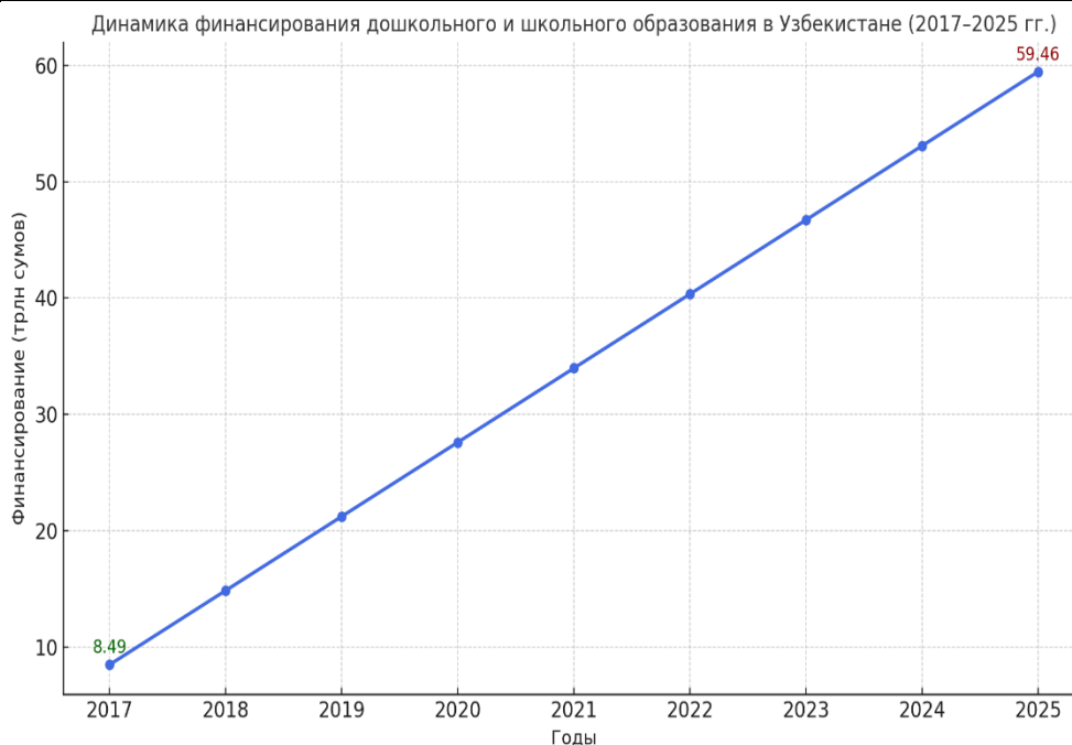
Рисунок 2. Динамика финансирования дошкольного и школьного образования в Узбекистане (2017–2025 гг.)

Проведённый анализ показал, что дошкольное образование в Узбекистане развивается ускоренными темпами благодаря значительному росту финансирования. Увеличение бюджета (до 59,46 трлн сумов в 2025 году), предоставление субсидий (1,2 трлн сумов в 2023 году), а также рост количества негосударственных учреждений (до 24 058) свидетельствуют о приоритетности данной сферы.